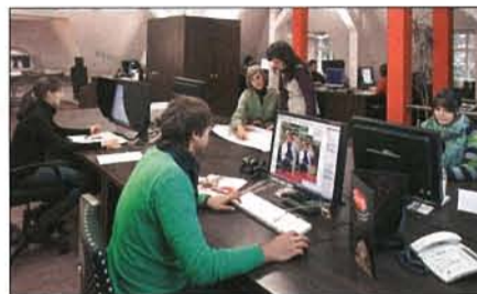
Ideen-Brutstätte: Zebra bei der Arbeit