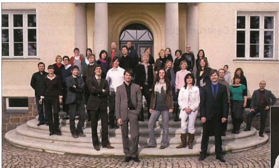
Starke Mannschaft: Die Mitarbeiter der Chemnitzer Agentur vor ihrem Büro

Zebra rüstet sich für die digitale Zukunft und kooperiert mit Mindbox